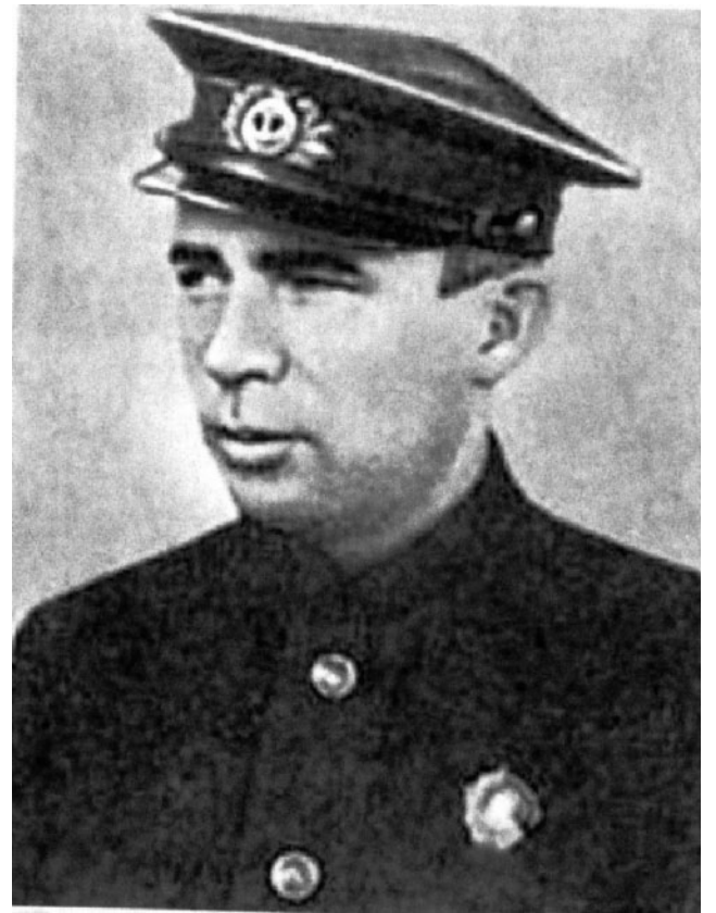
Александра Ивановича Маринеско.

Более всех был потрясен гибелью «Вильгельма Густлофа» главнокомандующий кригсмарине гросс-адмирал К. Денниц. Окончательно рухнула его «стратегия тоннажной войны», а также его надежда на удушение Англии в подводной блокаде с помощью новых «чудо-лодок», а затем — одержать победу на втором фронте над англо-американцами, заключив с ними сепаратный договор и перенести тяжесть войны на