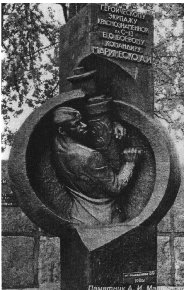
Первый памятник Маринеско. г. Кронштадт.