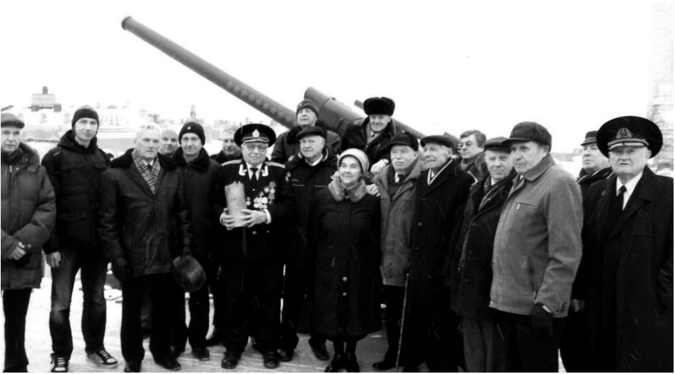
На фото слева направо (первый ряд):