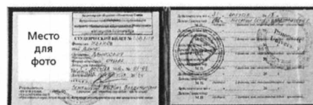
при оформлении абонементных билетов и разовых билетов в терминалах самообслуживания

Для оформления в терминалах самообслуживания разового проездного документа (билета) необходим электронный носитель, при контроле проезда в поездах пригородного сообщения предъявляется студенческий билет (с фотографией) и электронный носитель