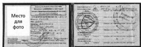
при оформлении в билетных кассах и пригородных поездах

Для оформления абонементного билета дополнительно предоставляется именной электронный носитель «Карта учащегося».